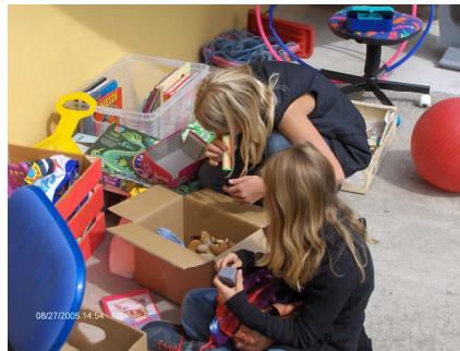
Les enfants aussi sont de la fête.