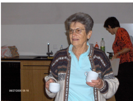
Du café ? Et une gaufre ?