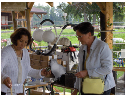
Ah oui Madame, c'est une bonne affaire.