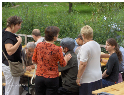
Au revoir et à l'année prochaine