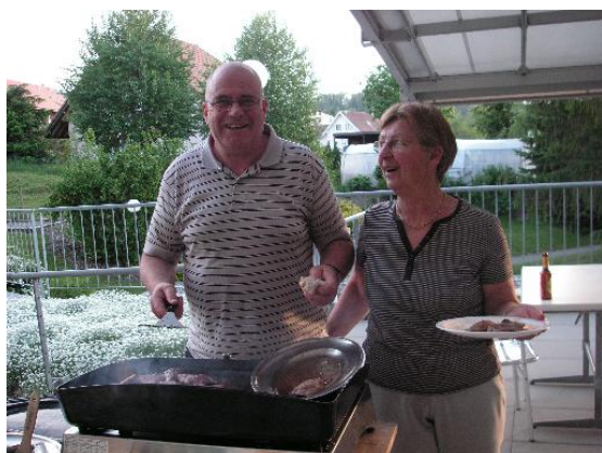
Soirée des chauffeurs à Farvagny – home du Gibloux