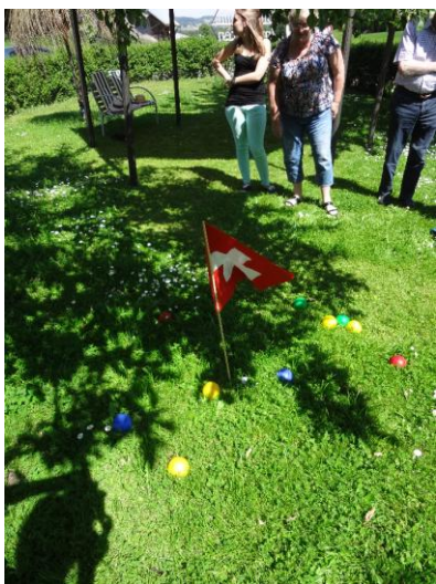
Les parties de pétanque ont recommencé avec les beaux jours