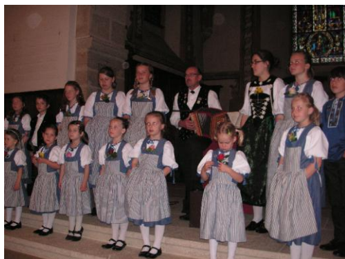
Le concert à Morat avec le « Jodlerchinderchörli Singspatze » de Kerzers