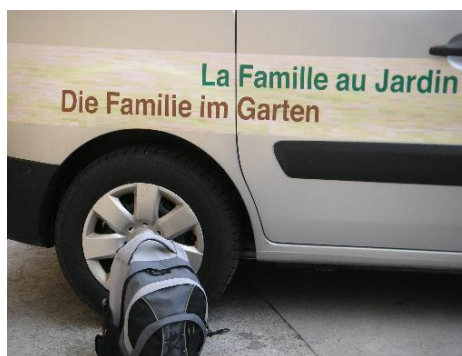
Course d'école pour le personnel au Papillorama