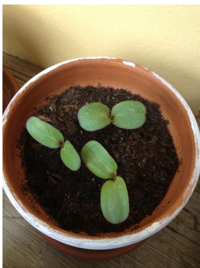
Et ça pousse !!!