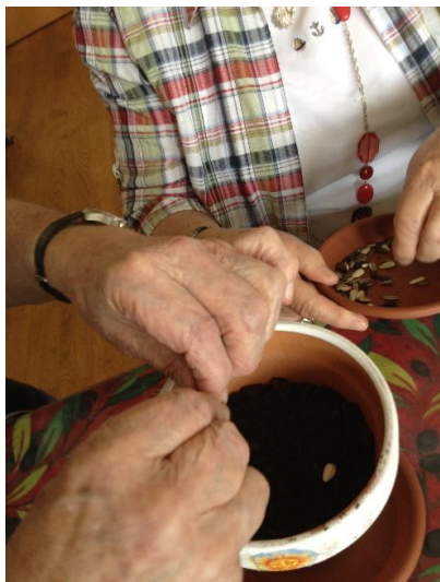
Je plante ...