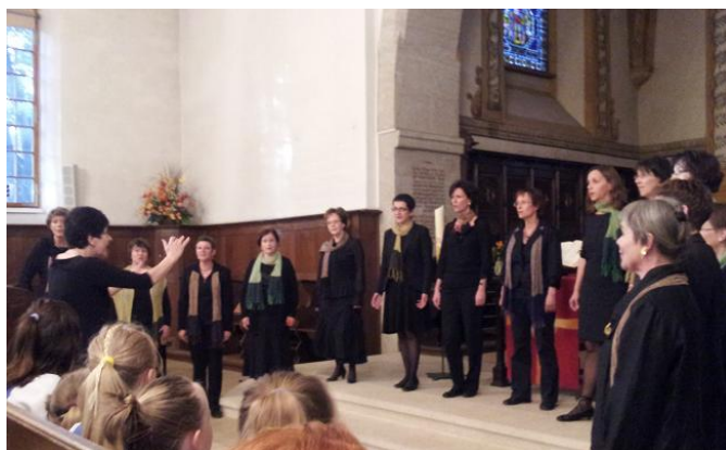
Le concert à Morat avec le chœur « VOCALISE » de Villars-sur-Glâne