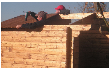
Construction de notre cabane de jardin