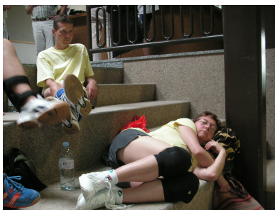
Après plusieurs matchs.... Ou peut-être avant....