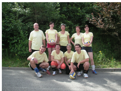
L'équipe de « La Famille au Jardin, lors du tournoi de volley-ball des institutions sociales fribourgeoises, en juin 2007

Les personnes qui auront trouvé la solution recevront un petit cadeau lors de notre brocante du 1er septembre prochain.